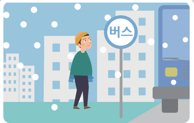
개인 차량 이용을 줄이고, 대중교통을 이용합니다.