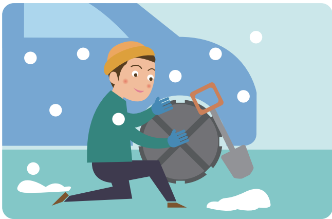
스노체인, 염화칼슘, 삽 등 자동차 월동용품을 준비합니다.