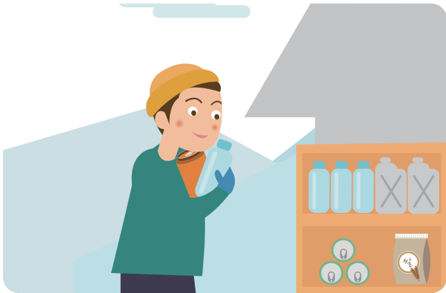
산간 고립 우려 지역에서는 식량, 연료 등 비상용품을 준비합니다.