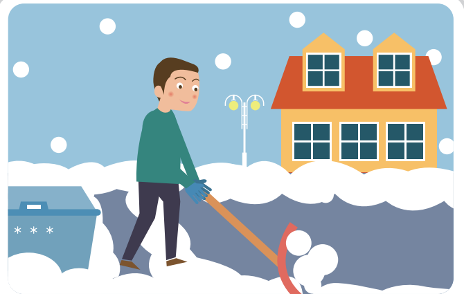
내 집 앞 눈을 수시로 치웁니다.